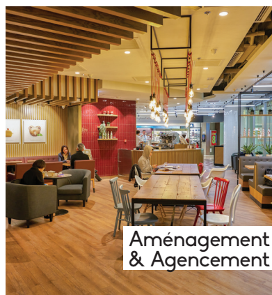
Aménagement & Agencement