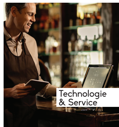
Technologie & Service