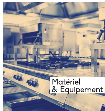
Matériel & Équipement